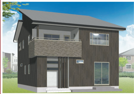
完成現場/小山市花垣町2丁目 S様邸